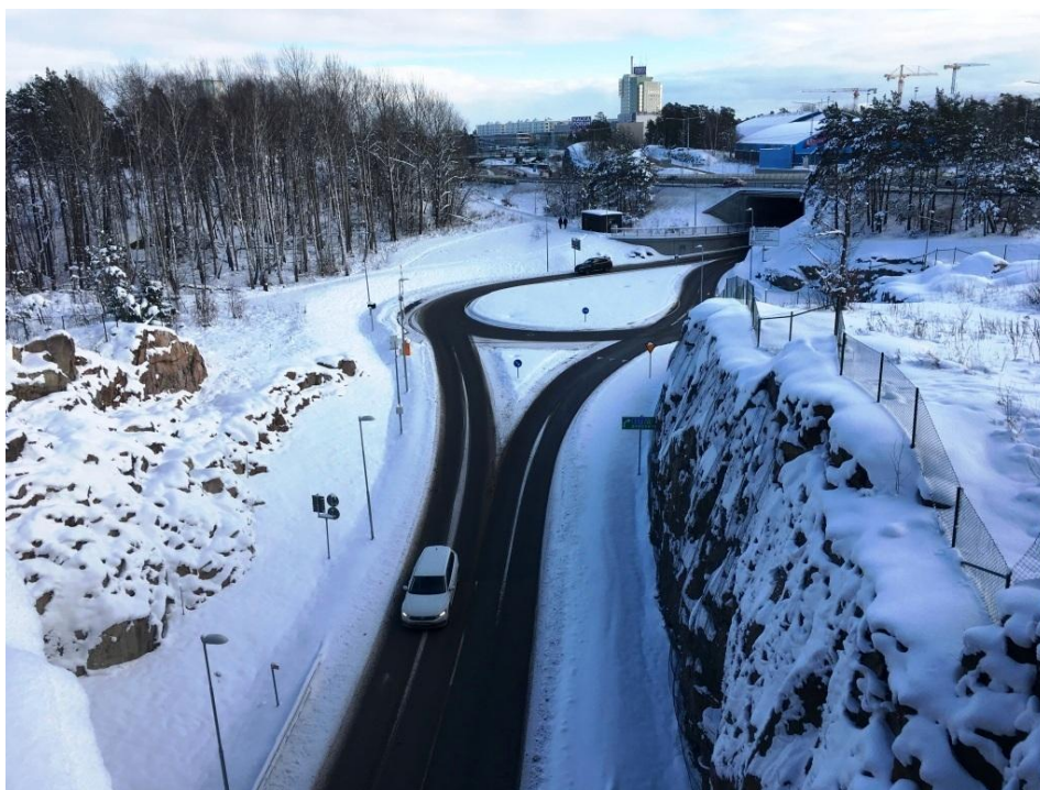
Här i detaljplanens östra del ska huvudgatan i passera för sedan ansluta till cirkulationsplatsen. Trafikplatsen ska senare utvidgas i etapper.